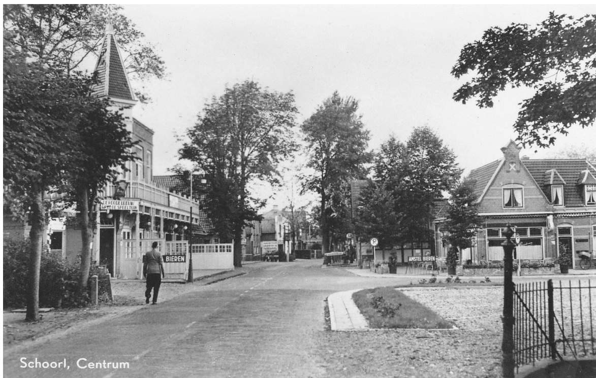
Afbeelding 1: Kruispunt Laanweg/Duinweg (rond 1950) gericht naar het noorden.

Tijdens de voorbereiding wordt gebruik gemaakt van de creativiteit van de belanghebbenden in het gebied. Hierbij wordt ook de inbreng die in het verleden is gegeven en beschreven staat in de "Visie Dorpshart Schoorl" betrokken. Belangrijk is dat er overeenstemming is tussen alle partijen. Een ingenieursbureau krijgt de opdracht om op basis van de randvoorwaarden en de gezamenlijke bepaalde ambitie een schetsontwerp te maken. Van het schetsontwerp wordt na de informatieavond een voorlopig ontwerp (v.o.) gemaakt, die inclusief financiële paragraaf wordt voorgelegd aan de raad.