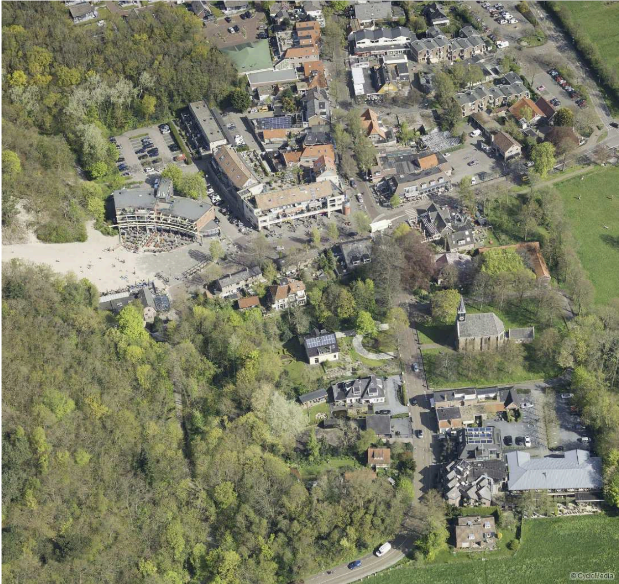
Afbeelding 2: gedeeltelijk overzicht project (luchtfoto in vogelvlucht, 2016)